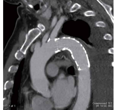
術後 CT サジタル

※QRコードからデバイス展開とアンギュレーションコントロールの動画をご覧ください