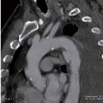
術前 CT サジタル