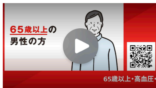
院内ディスプレイ用疾患啓発動画